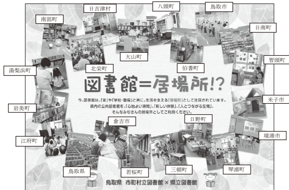
表紙には県内全ての市町村に設置されている図書館の写真を使用