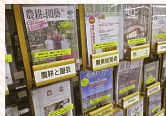
農業関連雑誌 (県立図書館)