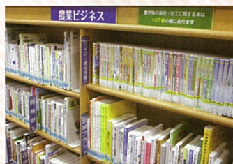
農業ビジネス関連本 (県立図書館)