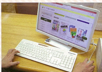
ルール電子図書館