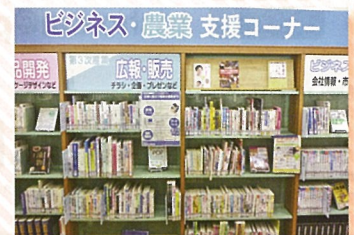
ビジネス農業支援コーナー (倉吉市立図書館)