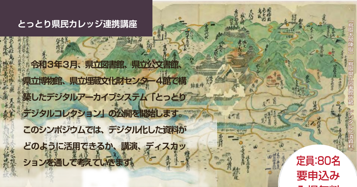
「鳥取大内陣取」

令和3年3月、県立図書館、県立公文書館、 県立博物館、県立埋蔵文化財センター4館で構 築したデジタルアーカイブシステム「とっとり デジタルコレクション」の公開を開始します。