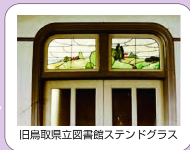
旧鳥取県立図書館ステンドグラス