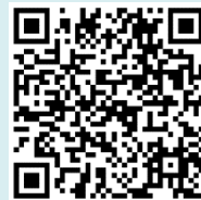
県立図書館ホームページ