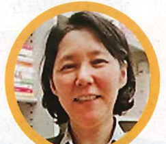
共催:米子市立図書館