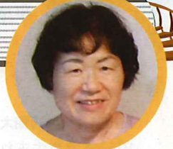
共催:倉吉市教育委員会