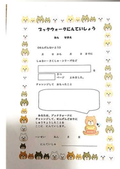
ブックウォーク宣言書(上)、認定書(下)